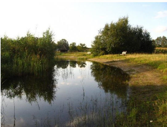
Eigen grond bij Lemele met schuilhut.

In 1995 werd gestart met de eerste 2 fietsroutes met beschrijvingen van landschap, cultuurhistorie en boerenbedrijven. Later volgden meer fiets- en ook wandelroutes.