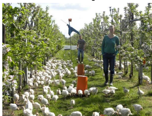
Kippen in de boomgaard ; agroforestry

Over deze aandachtsgebieden wil zij informatie verstrekken en er projecten voor opzetten. De lijst is variabel en wordt steeds aangepast aan de (komende) opgaven en vragen.